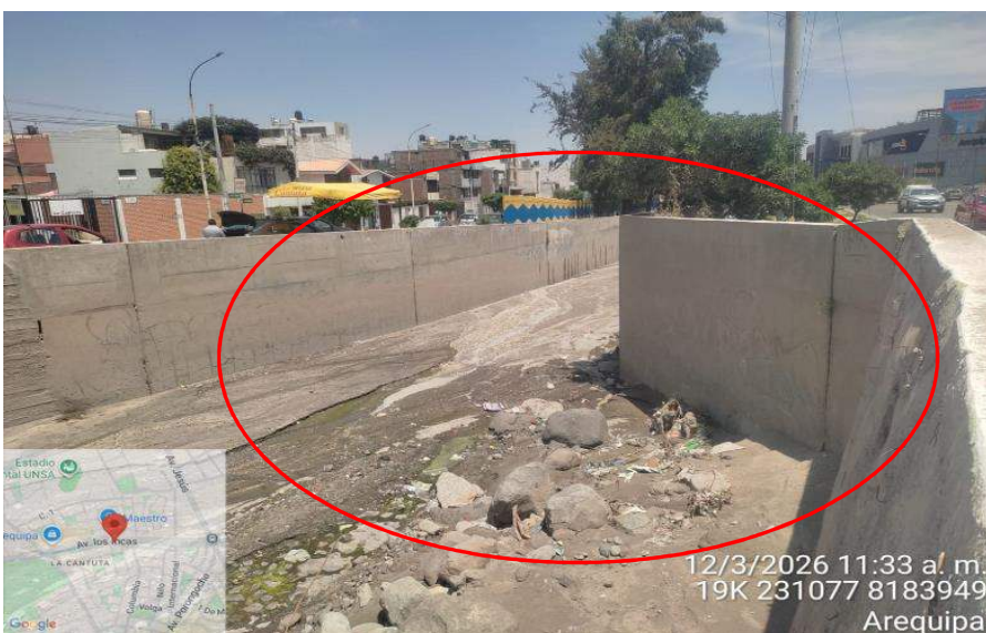
FIGURA N°02: TRAMO CRÍTICO SE MUESTRA LA COLMATACION Y LA REDUCCION DEL ANCHO DE CAUCE, EN UNA MAXIMA AVENIDA, LA QUEBRADA SE DESBORDA HACIA LA MARGEN DERECHA OCACIONADO LA INUNDACION Y EROSION AFECTANDO VIAS Y VIVIENDAS Y CENTROS COMERCIALES