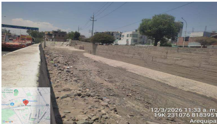
FIGURA N°01: TRAMO CRÍTICO EN LA QUEBRADA LOS INCAS, SECTOR LA CANTUTA COLMATADO TIENE UN ANCHO DE CAUCE IRREGULAR CON PELIGRO A DESBORDARSE EN LA MARGEN DERECHA